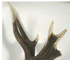
Kronen: Meget variabel. Siger kun lidt om alder.