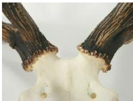
Rosenstokke: Ca. 12-årig ulige 18-ender.