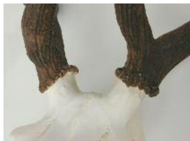
Rosenstokke: Ca. 7-årig ulige 8-ender.